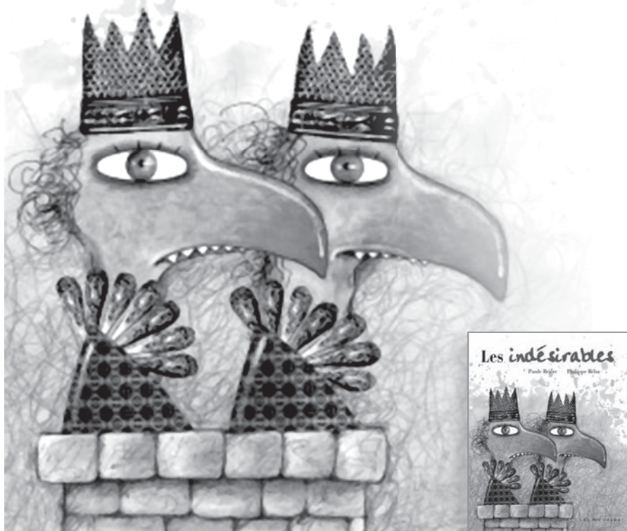
Illustration : Philippe Béha (Les indésirables)

L es différences !... Elles sont nombreuses dans une classe. Un élève vient d'un autre pays, un autre est roux, une élève a un trait physique particulier... Comment aborder le sujet avec les élèves de tous les cycles ? Comment aborde-t-on la discrimination, le rejet en raison des différences et la peur qu'elles suscitent et qui mènent à la violence ?