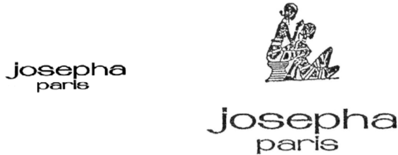
Figure 1 Logos de la ligne Josépha

le décrit Dambury. Ce sont ces scènes et postures très significatives que Josépha reproduira dans le logo de sa marque (voir la figure 1 ci-dessous).