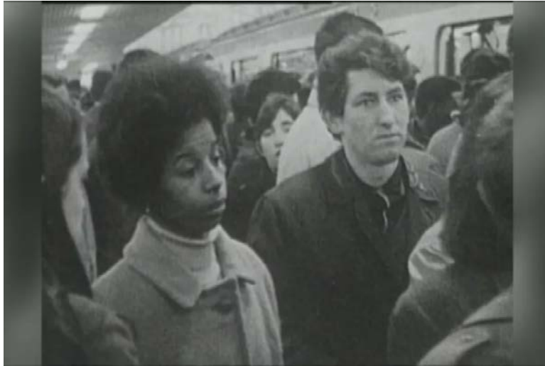
Figure 5 Une Antillaise dans le métro durant les années 60

d'une femme dont les cheveux défrisés lui évoquaient les poils raides d'une queue de cochon, mais qui, néanmoins, se drapait dans un sentiment de supériorité conféré par le défrisage. Généralement, celui-ci était pratiqué de manière à ne pas laisser le cheveu entièrement raide, et était complété par une mise en plis à l'aide de bigoudis ou de papillotes, ce qui donnait ainsi un certain volume à la coiffure. La figure 5 en est un exemple.