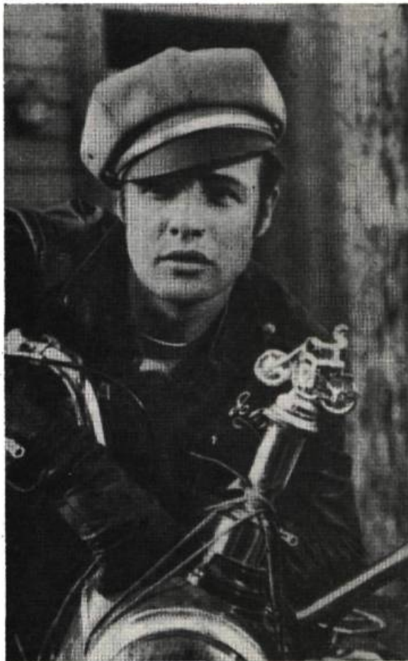
Marlon Brando dans The Wild One

« investissement » de la personne qu'Eisenstein, très loyalement, considérait comme une des fonctions essentielles du cinéma. Dans ces perspectives, on peut se demander si tout le cinéma russe, de Poudovkine jusqu'à Tchoukrai ne souffre pas de ces tares psychologiques autant qu'esthétiques : esprit de lourdeur, schématisme, raidissement moral, substitution de l'illustration à l'expression. A la limite, un certain viol mental du public serait le commun dénominateur de la production soviétique, du cinéma hitlérien, de la machine à rêves de Hollywood. Dans ces trois cas, en donnant aux mythes personnels ou collectifs, érotiques ou politiques, un degré de présence aussi écrasant que possible, on pousserait à ses possibilités extrêmes tout ce qui dans le septième art permet d'imposer quelque chose. Inutile d'insister