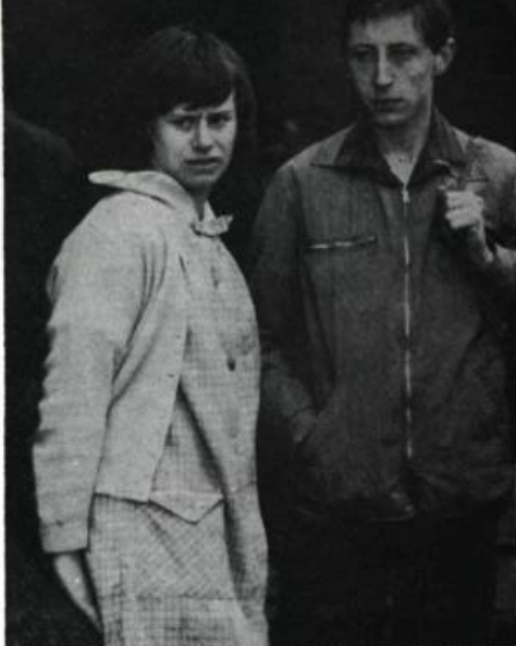
A Taste of Honey , de Tony Richardson

Après l'épuisement de cette première vague socialistico-réaliste, le public se trouvait un peu fatigué de ce mouvement surnommé familièrement kitchen-sink school . Plusieurs réalisateurs s'étaient peut-être pris un peu trop au sérieux. Le public était prêt à accueillir un peu de comédie. Il fut ravi de découvrir que le sens britannique du non-sens (si ce jeu de mots m'est permis) recommençait à se manifester. Clive Donner, un jeune réalisateur de grand talent, qui devait donner plus tard The Caretaker , produisit une satire très drôle, quoique féroce, du système de classes, intitulée Nothing but the Best . Au même moment, Peter Yates réalisait l'adaptation d'une pièce merveilleusement absurde de N.F. Simpson, One Way Pendulum . Il