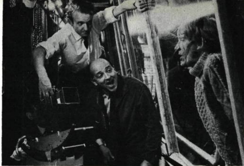
Karel Reisz tournant Morgan