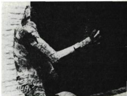
Les Caméléons, de Patrick Halla

Première catégorie : les films franchement mauvais. Une bonne dizaine! Tous des films qui prétextaient de l'expérimentation pour délivrer un contenu libidineux, voire pornographique (je pense notamment à 1967 de l'américain Al Rose, qui prétend décrire l'itinéraire, dans la vie, d'un garçon solitaire, mais qui, en fait, raconte ses émois pubertaires, ses vices intimes, selon un traitement qui ne laisse pas de doutes sur les propensions homosexuelles de l'auteur; à Spiracle de l'américain Robert Beavers; à The Embryo , surtout, du japonais Koji Wakamatsu, dont le sadisme échevelé, "exemplaire, avoue naïvement l'auteur, de l'actuelle production du Japon", a soulevé une tempête de protestations dans toute la salle). Que l'on me comprenne bien: je ne porte pas ici un jugement de morale chrétienne; je me situe à l'intérieur d'une morale que tous acceptent plus ou moins tacitement, la morale de l'oeuvre, ou la morale proprement esthétique. Je m'insurge contre le mythe, courant aujourd'hui dans le cinéma et les autres arts, du sexe considéré comme un des beaux-arts. Le culte du corps (masculin ou féminin) n'a pas une valeur esthétique en soi; le traitement en image de l'acte sexuel ou du plaisir érotique n'est pas automatiquement signe de réussite