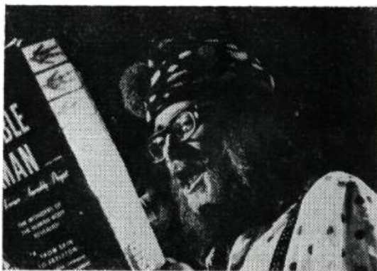
La Nuit de la poésie

J.-C. L. - Bien sûr, c'est un premier long métrage. Nous l'avons tourné en quatre semaines et demie. C'est un peu trop rapide. J'ai à peine eu le temps d'établir la structure. Généralement, dans les courts métrages, je faisais la structure et bien d'autres choses... Pour Les Smattes , j'ai eu à peine le temps de faire l'épine dorsale que tout était terminé.