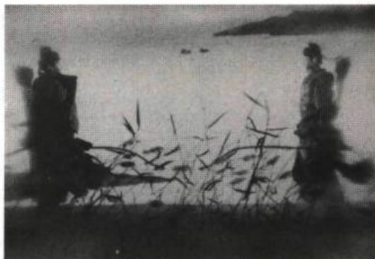
La Maison des flammes , de Kihachiro Kawamoto