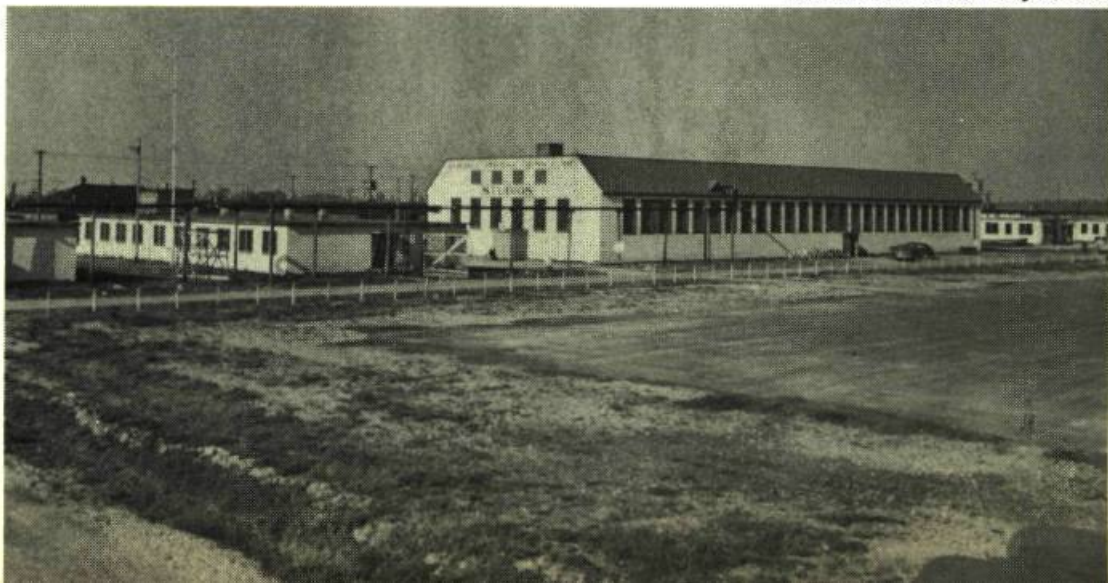
Les Studios de Saint-Hyacinthe.