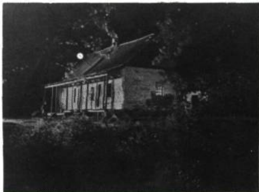
La maison de Séraphin à Saint-Adèle