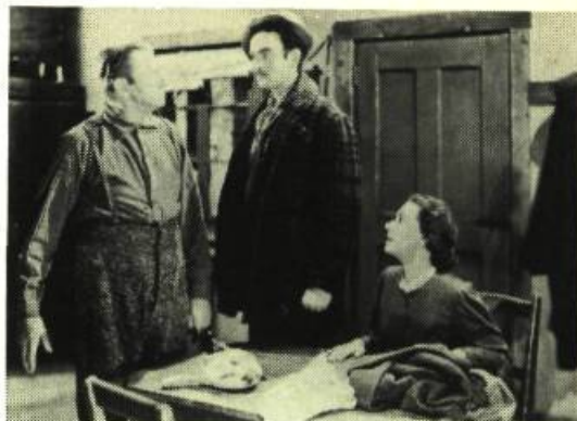
Un Homme et son péché