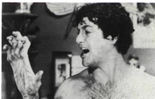
An American Werewolf in London, de Joe Dante

Le second film, The Howling , bénéficie d'un scénario incontestablement plus élaboré, (d'après le roman de Gary Brandner) mais aussi plus touffu.