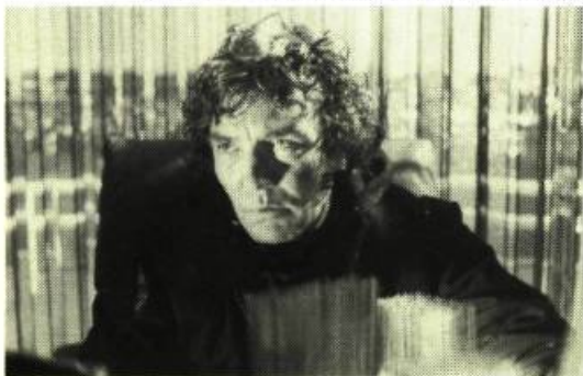
Wadleigh Wolfen , de Michael Wadleigh

tir à travers les yeux et le cerveau des loups, communiquant au spectateur, avec une rare intelligence, la vision, la rapidité et les démarches du loup, l'identifiant du même coup aux vrais héros de l'histoire, tour de force habile et peu commun.