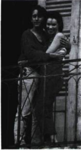
37°2 le matin

— C'est le genre de sujet qui n'est attaché à rien de spécifique aux États-Unis et auquel un réalisateur étranger pourrait apporter un point de vue extérieur.