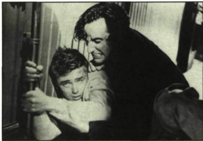
East of Eden d'Elia Kazan

préchorégraphiée. C'est ce que confirment ses confrères de travail dans les témoignages qu'ils nous ont laissés, mais le spectateur peut vérifier par lui-même que Dean achève la construction de son personnage à l'intérieur même des plans. Il nous laisse assister au processus de création, instaurant par le fait même l'impression de spontanéité si chère à la Méthode . La scène d'ouverture de East of Eden est paradigmatique de cette façon de procéder.