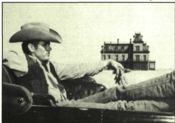
Giant de Georges Stevens

Cette étude est un texte remanié de celui publié dans Making Visible the Invisible: an anthology of original essays on film acting publié chez The Scarecrow Press Inc. en 1990.