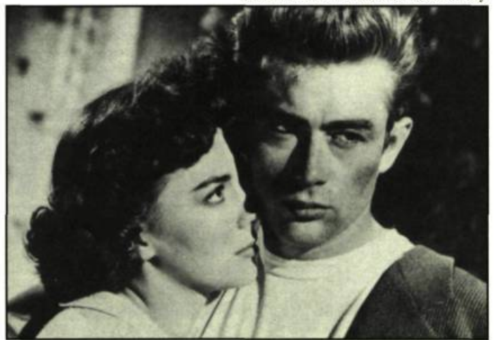
Rebel without a Cause de Nicholas Ray

Dans East of Eden , les scènes qui regroupent James Dean et Julie Harris sont particulièrement révélatrices de la problématique que je viens de soulever. Plus souvent qu'autrement, Elia Kazan force sa jeune actrice à contempler la souffrance de James Dean. C'est le cas de la scène de flirt nocturne lorsque Cal vient réveiller Abra, qu'interprète Harris, pour lui faire part de son idée d'organiser une réception. Dans une série de champs-contre-champs qui sépare optiquement les deux acteurs, la caméra de Kazan nous donne à voir le visage tour à tour taquin, câlin, ému et torturé de James Dean. Encore une fois, sa prestation est un délice à décortiquer; elle se lit comme un poème. Cal se tient sur une corniche, près de la fenêtre d'Abra. Il veut la persuader de l'aider dans son entreprise et lui en fait doucement la demande. Sa voix, voilée par les vapeurs de l'alcool, est langoureuse. Mais encore une fois, c'est surtout la gestuelle de l'acteur qui communique sa pensée. Il regarde sa compagne tendrement, approche son visage du