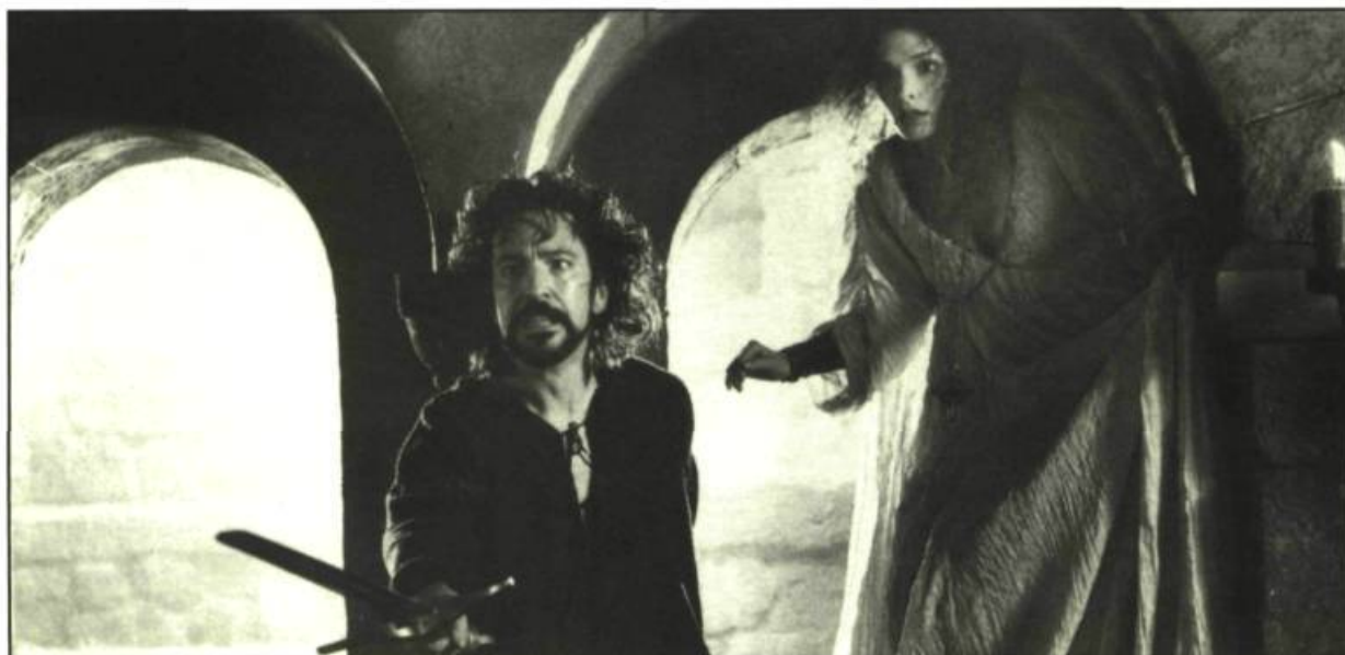
Robin Hood, Prince of Thieves de Kevin Reynolds

il s'y prend pour l'obtenir. On ne recherche pas les bons côtés, on joue ce qui est écrit et c'est là que l'on trouve l'énergie du personnage. C'est au public de décider s'il l'aime ou non. J'essaie toujours de faire rire le spectateur, évidemment. Ce n'est pas toujours possible, mais ce peut être un rire ironique, pas nécessairement du slapstick . Dans Robin Hood , je crois que c'est important, étant donné qu'à la fin du film il y a une scène de viol. On sait qu'il y aura des enfants dans la salle, alors ce doit être tempéré.