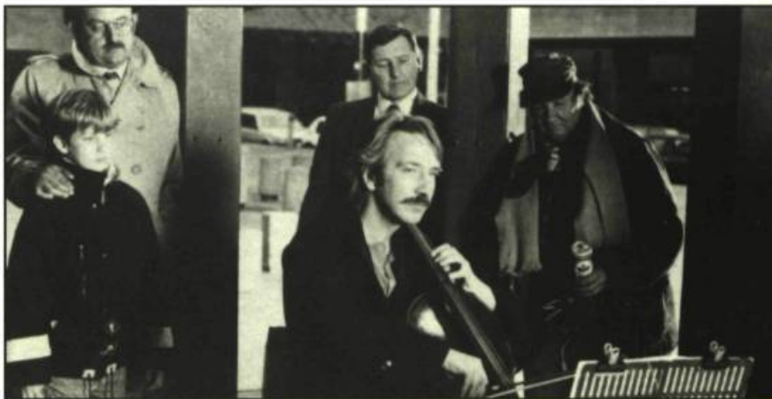
Truly, Madly, Deeply d'Anthony Minghella

— J'ai essayé de l'étoffer le plus possible, mais on ne sait pas grand chose de lui. Vous savez, le film s'inspire d'événements