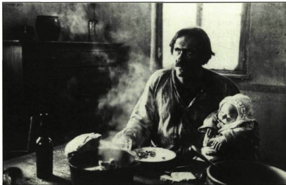
Gérard Depardieu dans Germinal

— Comme le personnage est russe, je pensais, au départ, à un acteur soviétique. Mais il y avait beaucoup de textes à dire. Quand vous voyez le film, vous ne voyez pas tout ce que j'ai tourné. J'ai fait des coupes assez sombres dans le personnage