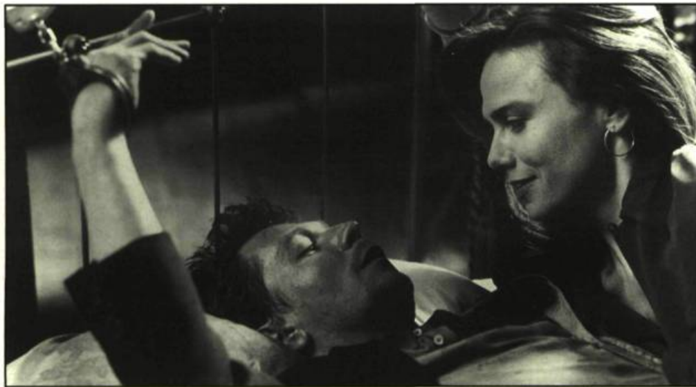
Gary Oldman et Lena Olin

À l'opposé d'un Quentin Tarantino, chez qui la violence sans fondement éclabousse les murs à intervalle régulier, le metteur en scène de The Krays et Let Him Have It la suggère souvent plus qu'il ne