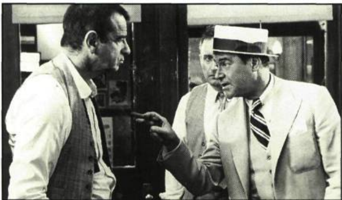
The Front Page

Mais le sujet de prédilection des scénaristes américains lorsqu'ils se penchent sur le genre journalistique reste encore et toujours la presse à sensations. On ne compte plus les films qui dénoncent les travers de cette