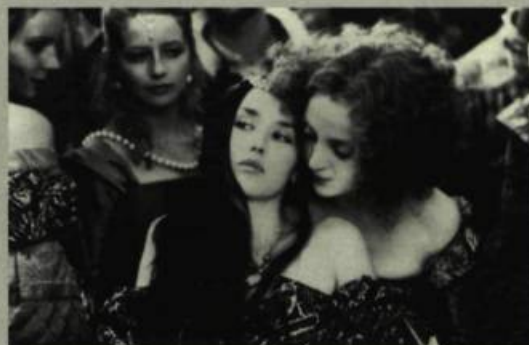
La Reine Margot