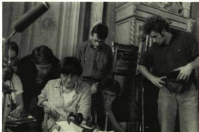
Agnès Varda entourée de son équipe de tournage