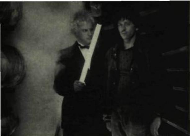
avec Christophe Lambert dans Subway