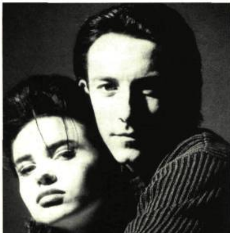
avec Béatrice Dalle

Il peut passer en une fraction de seconde de l'étonnement le plus enfantin à la cruauté la plus sinistre.