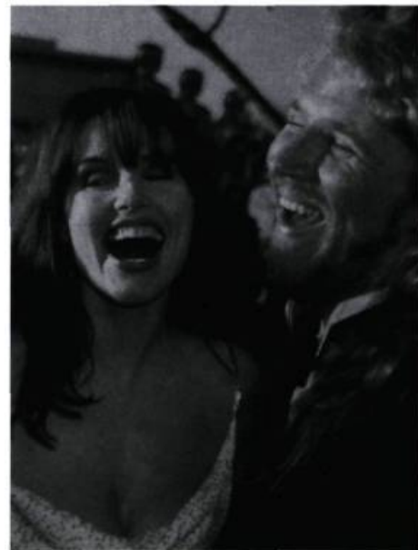
Geena Davis et Renny Harlin

La sortie reportée à l'automne de Cutthroat Island de Renny Harlin, avec en vedette Geena Davis et Matthew Modine, met en sérieuses difficultés financières la compagnie de production Carolco.