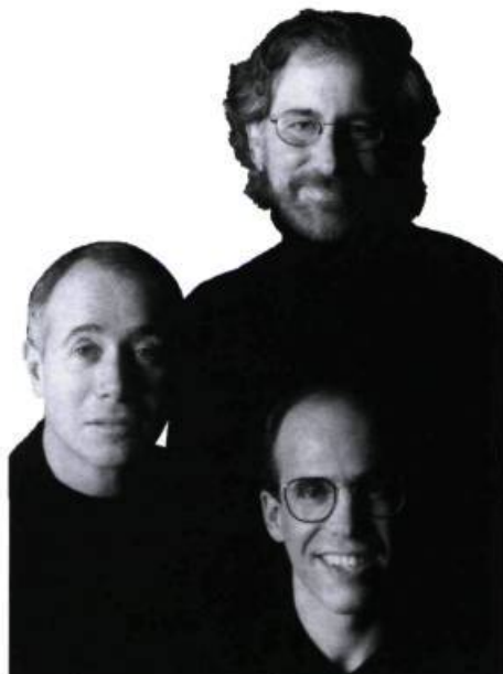
Steven Spielberg, David Geffen, Jeffrey Katzenberg

Ted Turner, par l'injection de capitaux importants, a décidé de faire de New Line un major. On attend beaucoup par ailleurs du studio créé par Steven Spielberg, Jerry Katzenberg et David Geffen, KG Dreamworks.