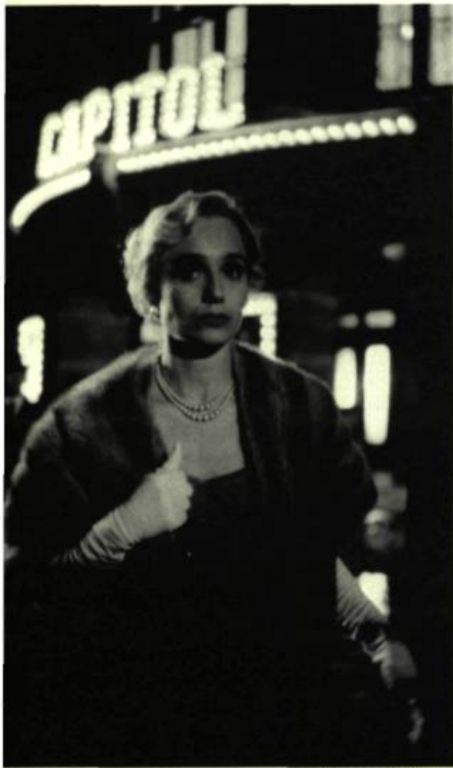
Kristin Scott Thomas

rarement (pour ne pas dire jamais) nos créateurs affichent-ils une quelconque allégeance à un mouvement international, une école étrangère ou, horreur, un genre hollywoodien. Pourtant, ailleurs dans le monde, des cinéastes, peut-être plus sûrs de leur identité culturelle, ne se gênent pas pour revendiquer leur droit d'appartenir à la famille cinématographique de leur choix. Et grand bien leur fasse. À l'heure où le cinéma québécois se cherche une nouvelle vocation, réfléchit à son avenir et rêve de rentabilité, évoquer Hitchcock peut prendre des allures de geste politique: une invitation à embrasser notre américanité et à prôner le cinéma de divertissement.