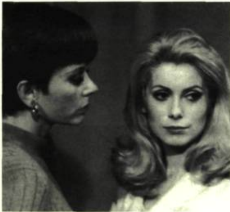
Geneviève Page et Catherine Deneuve

E n 1963, en Espagne, les censeurs du régime franquiste refusent de donner à Luis Buñuel le feu vert pour tourner une adaptation du roman Tristana de Benito Pérez Galdos. Dépit, le célèbre cinéaste met le cap sur la France où il se console en tournant Le Journal d'une femme de chambre . Il se rend ensuite au Mexique pour y filmer Simon du désert . De retour en France, il tente sans succès d'adapter à l'écran Le Moine de Matthew G. Lewis. De plus en plus las des vicissitudes de l'industrie cinématographique, Buñuel songe alors à la retraite. C'est à ce moment que les frères Robert et Raymond Hakim lui offrent de transposer à l'écran un roman de Joseph Kessel publié en 1929, Belle de jour . Stimulé par ce film de commande qu'il fera entièrement sien, Buñuel décide que ce sera son œuvre ultime, son testament cinématographique. À la sortie du film, en 1967, il déclare en effet: «Le cinéma pour moi c'est fini, je ne tournerai plus. Belle de jour est mon dernier film». Cette affirmation s'avérera présomptueuse, puisque en réalité Buñuel ne prit sa retraite que dix ans plus tard