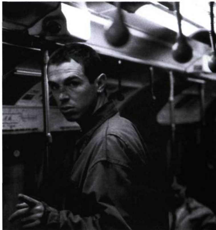
Nil By Mouth

Les souleries de Ray, les piqûres de Billy, leurs chasses aux substances psychotropes et leurs incontrôlables désespoirs forment le train-train des femmes de leur vie. Mère, femme, sœur, fille, grand-mère, nulle n'est à l'abri des colères de l'homme: elles encaissent en silence. Pour Oldman, les femmes sont les piliers de la famille brisée, les hommes se mouvant entre la prison et les pubs. Et pourtant, Nil By Mouth est dédié à la mémoire de son père. Sans doute pour souligner que, tout comme pour ce dernier et les figures paternelles ancestrales, il s'est écorché vif et a bouleversé les siens en apprenant à s'assumer comme homme.