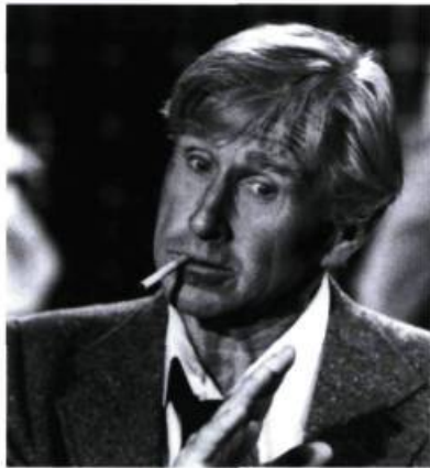
Airplane II: The Sequel

Lloyd Bridges (1913-1998) tourna dans quelque vingt-cinq films à petit budget pour la Columbia, uniquement entre 1941 et 1945. D'autres, plus solides, comme Home of the Brave (Mark Robson, 1949) et High Noon (Fred Zinnemann, 1952) le sortirent du trou, mais c'est la télévision qui finit par l'avaloir, particulièrement avec la télésérie Sea Hunt . Au cinéma, on se souviendra toutefois des