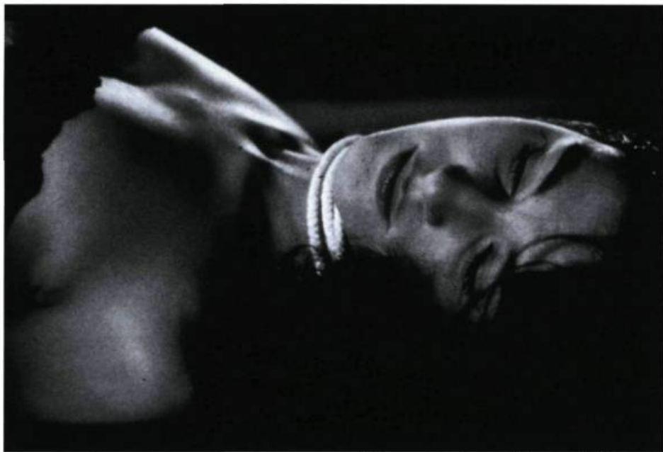
Le corps, comme une entité comprimée, étouffée