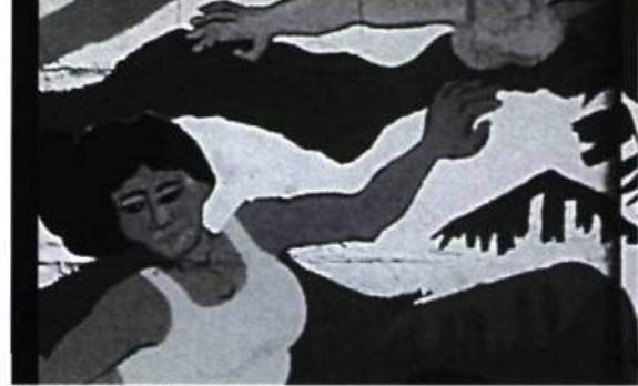
L'introspection d'un pays