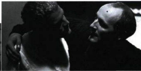
The Perfect Son