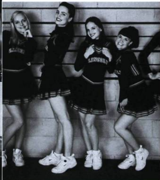
Sugar and Spice

ce dernier — Int. : Vincent Perez, Fanny Ardant, Josiane Balasko, Michel Serrault, Arielle Dombasle, Christian Charmentant, Françoise Lépine — Dist. : TVA International.