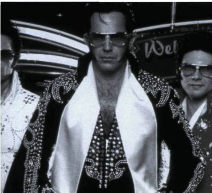
3000 Miles to Graceland