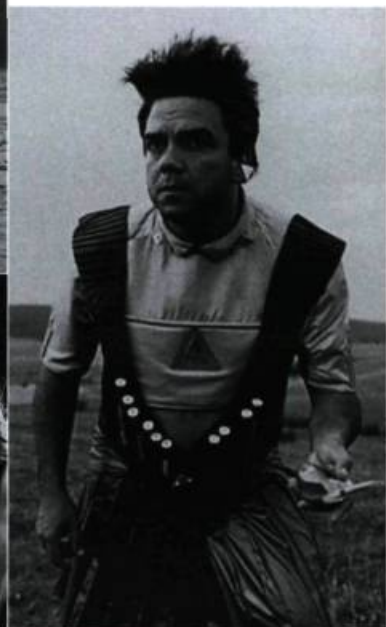
Get Over It