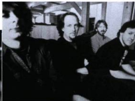
Down to Earth

vide d'une minime parcelle d'inspiration. On jurerait que le film a été fait il y a 25 ans. Scènes en spectacle, entrevues, vignettes de vie on the road sont rabouées dans une démonstration de complaisance et de nombrilisme pamphlétaires et racleurs. Les producteurs avaient peut-être espoir de capitaliser sur le succès d'un groupe dont les membres, à force d'avoir l'air cool devant la caméra et de parler pour ne rien dire, finissent par être antipathiques et vides d'intérêt pour le profane. Raté. (SF)