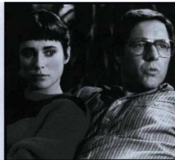
Le Déclin de l'empire américain, de Denis Arcand

La scène a imperceptiblement évolué quand Denis Villeneuve la reprend dans Un 32 août sur Terre . La directrice photo d'un magazine de mode s'endort au volant de son automobile en se rendant à l'aéroport, pour un tournage en Italie. Secouée, elle reprend sa vie en mains d'une façon surprenante : en démissionnant et en demandant à son meilleur ami de lui faire un bébé. « De