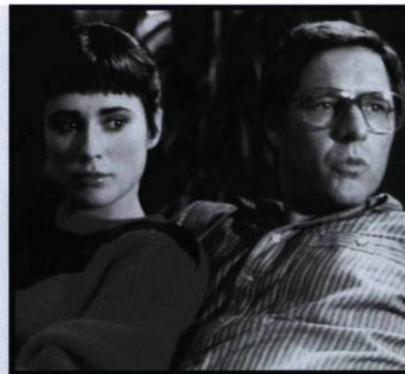
Le Déclin de l'empire américain, de Denis Arcand

La scène a imperceptiblement évolué quand Denis Villeneuve la reprend dans Un 32 août sur Terre . La directrice photo d'un magazine de mode s'endort au volant de son automobile en se rendant à l'aéroport, pour un tournage en Italie. Secouée, elle reprend sa vie en mains d'une façon surprenante : en démissionnant et en demandant à son meilleur ami de lui faire un bébé. « De