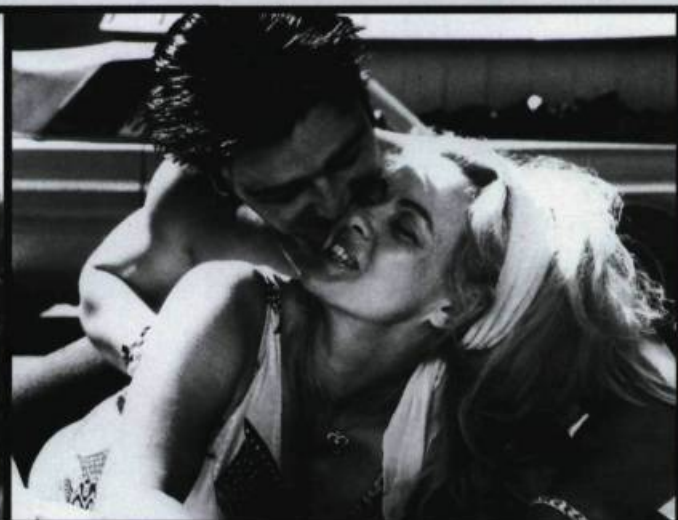
Sous-sol, de Pierre Gang

Une histoire inventée, d'André Forcier, proposait au début de la décennie un couple dans la même veine, celle des relations en douce. Les deux membres du couple affrontent la colère de la police et de la mafia en bons Roméo et Juliette postmodernes : avec des rires écervelés qui cachent sous la folie leur amour, comme s'il était impossible de vivre en couple dans un monde moderne, capitaliste, individualiste, cynique et schizophrène —