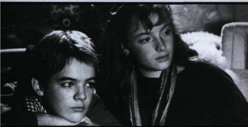
Sonatine, de Micheline Lanctôt