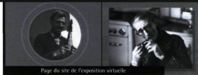
Page du site de l'exposition virtuelle

De Nanouk à l'Oumigmag, le cinéma documentaire au Canada