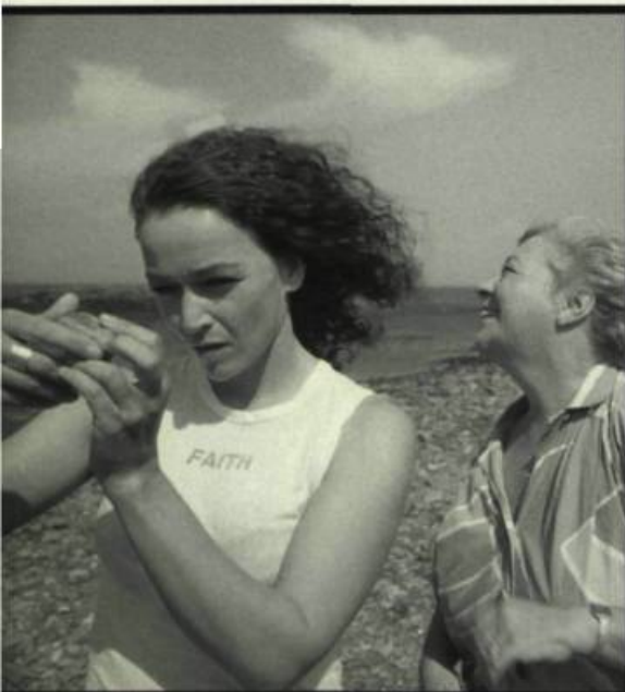
Les Fantômes des trois Madeleine