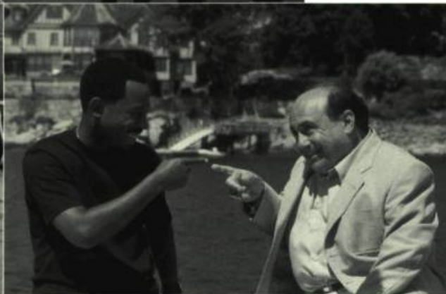
What's The Worst That Could Happen?