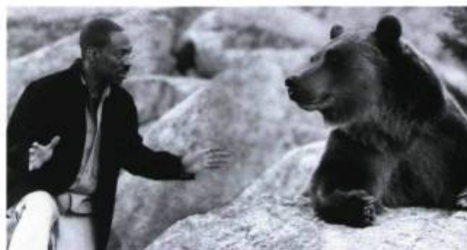
Dr. Dolittle 2