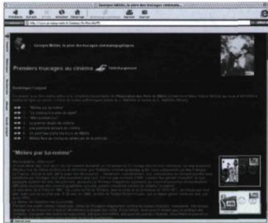
Georges Méliès : Le Père des trucages cinématographiques http://www.ac-nancy-metz.fr/cinemav/fx/fxm.htm