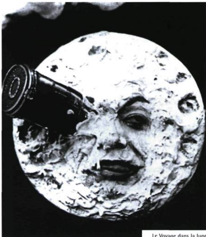
Le Voyage dans la lune

« Il n'y a pas un seul et unique inventeur du 7 e art, mais une multitude de chercheurs plus ou moins actifs qui, depuis la Renaissance, ont œuvré dans des sens différents, sans penser à un avenir aussi phénoménal, mais toujours dans le but d'étudier ou de recréer le mouvement. » Cette sage affirmation qui pourrait mettre fin à bien des débats est tirée d'une exposition sur Internet intitulée Étienne Jules Marey : Le Mouvement en Lumière . Conçue et produite conjointement par la Maison du cinéma et la Cinémathèque française, cette exposition témoigne du rôle qu'a joué Marey dans l'invention du cinéma : bien que n'ayant jamais véritablement cherché à créer le spectacle cinématographique, ce sont avant tout ses recherches ainsi que celle de Thomas Edison qui ouvriront la porte aux frères Lumière et à ceux qui les suivront. Comprenant entre autres quelques photographies ainsi qu'une animation démontrant le fonctionnement de la caméra de Marey, ce site constitue une excellente entrée en matière.