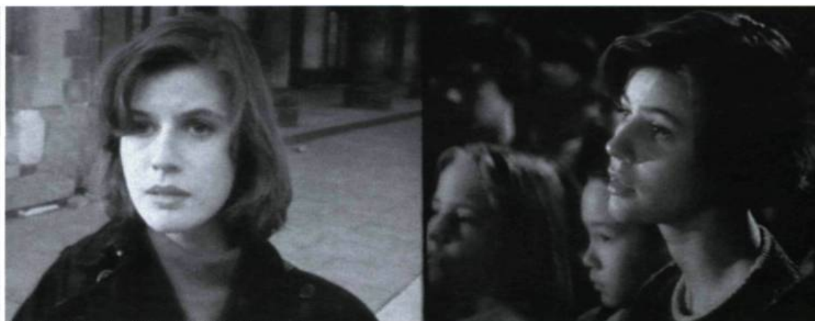
Véronika et Véronique ( La Double Vie de Véronique )