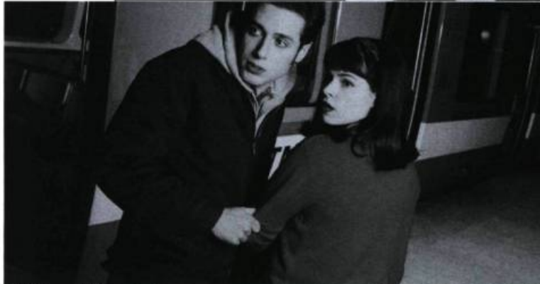
A Problem with fear