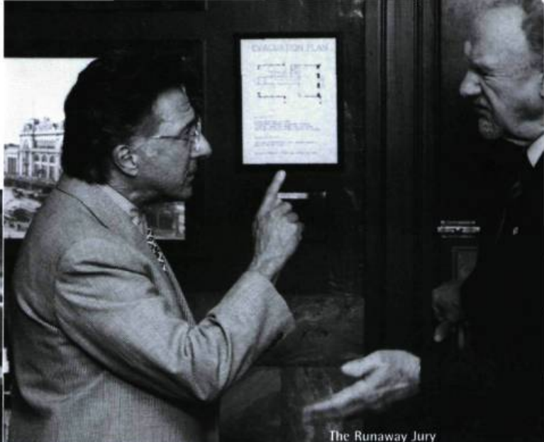
The Runaway Jury