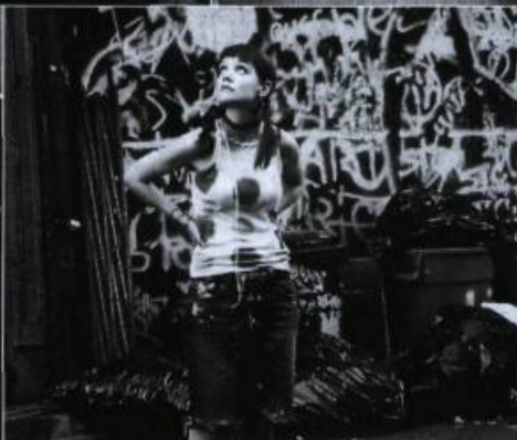
Pieces of April