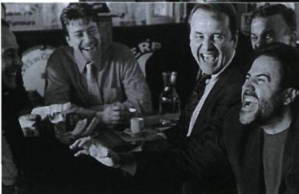
Rire et châtement