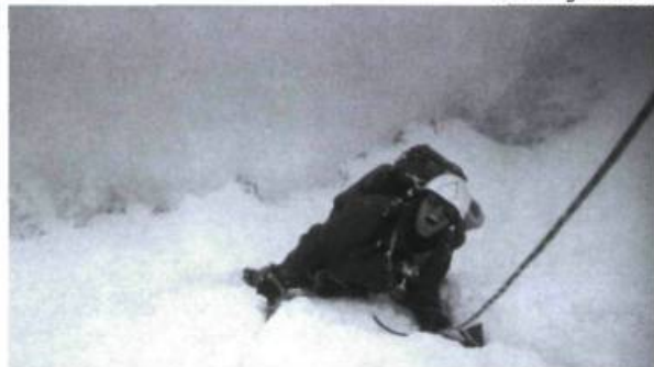
Touching the Void