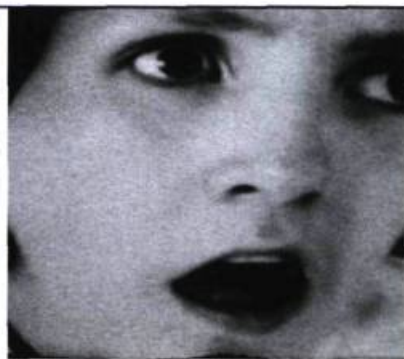
Le Petit Jésus