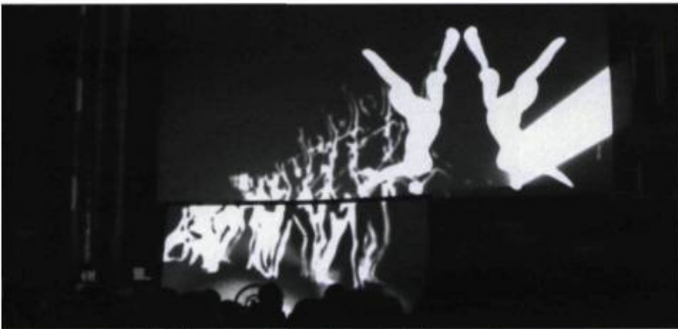
Tout doit devenir, après beaucoup de travail, un dialogue sur écran

font des dons, dont récemment un CLSC : c'est plutôt inédit d'assister, dans une même soirée, sur écran de cinéma, en 16mm, à quatre accouchements non-stop ! Je tourne aussi beaucoup d'images vidéo 16mm et photographique 35mm. Je prends un plaisir peut-être coupable à filmer en recadrant des séquences de films déjà existant projetées sur l'écran... pour les réintroduire à nouveau en projection dans leurs nouvelles formes. Mais l'important, malgré cette arborescence, c'est que tout doit devenir, après beaucoup de travail, un dialogue sur écran.