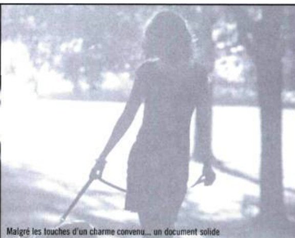
Malgré les touches d'un charme convenu... un document solide