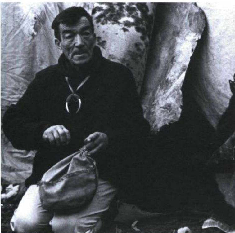
Ntesi nana shepen

En 1997, le festival Présence autochtone à Montréal recevait le réalisateur bolivien Jorge Sanjines pour une rétrospective de ses œuvres. D'origine amérindienne par sa mère, le cinéaste avait porté déjà un grand coup par son premier long métrage, Ukamau , primé à Locarno. Dans des œuvres comme Yawar Malku et Fuera de aqui , la langue quechua devient une partie primordiale du discours; leur filmage en cercles concentriques met l'accent sur le sens communautaire des discussions et décisions. Ces films sont des fictions extrêmement bien documentées. Ainsi, Yawar Malku / Le Sang du condor a obligé le Peace Corps américain à changer certaines pratiques.