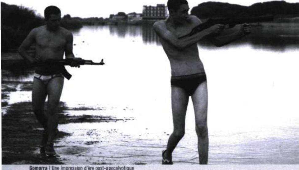
Gomorra | Une impression d'ère post-apocalyptique

Ce qui impressionne lorsqu'on voit coup sur coup Gomorra et Il Divo , sortis presque simultanément sur nos écrans, c'est la force d'une démarche artistique qui semble vouloir aller au-delà des dogmes et qui transcende le discours politique. Les auteurs de ces films, Matteo Garrone et Paolo Sorrentino, échappent aussi aux soupçons de maniérisme ou même d' a priori politique puisque leur approche respective traduit d'abord une volonté de forcer un regard nouveau et, plus encore, de proposer une nouvelle attitude morale ; tout comme les cinéastes du néoréalisme et de la génération 60 ont su réinventer l'écriture filmique à une époque où la société italienne ressentait le besoin de s'interroger sur ce qu'elle était en train de devenir.