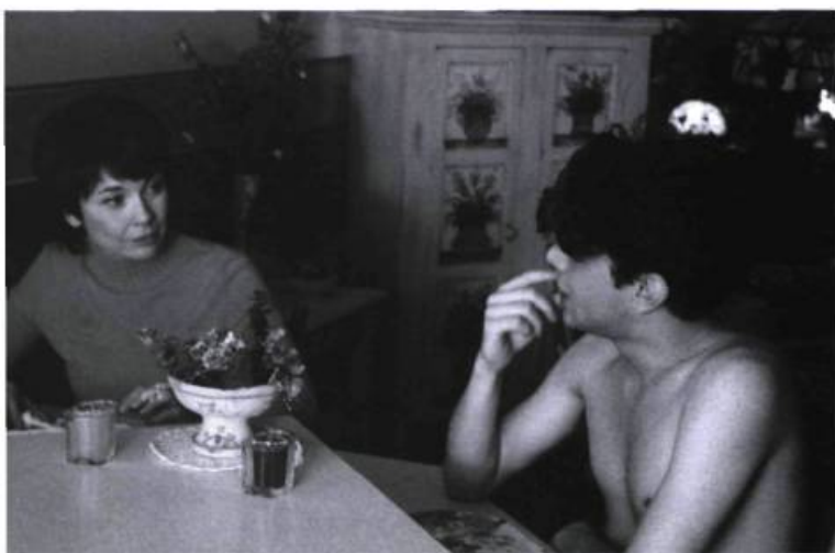
Une fiction agitée, et somme toute assez verbeuse.