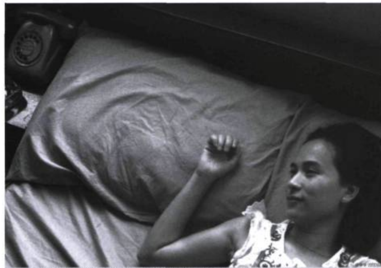
C'est ainsi le geste, plus que le visage et ses expressions, qui traduit l'émotion

La séquence finale, qui s'entame avec des plans montrant les toits de la ville, suggère l'indifférence de celle-ci devant la mort de Ton. La ville, que ce soit à la suite d'un événement majeur comme le tsunami ou plus personnel comme la mort de Ton, survit aux drames individuels ou collectifs qui jalonnent son histoire. En fin de parcours, les deux petites filles vêtues de rose s'amusant sur les toits pourraient par ailleurs annoncer des lendemains plus prospères pour la petite ville et ses habitants.