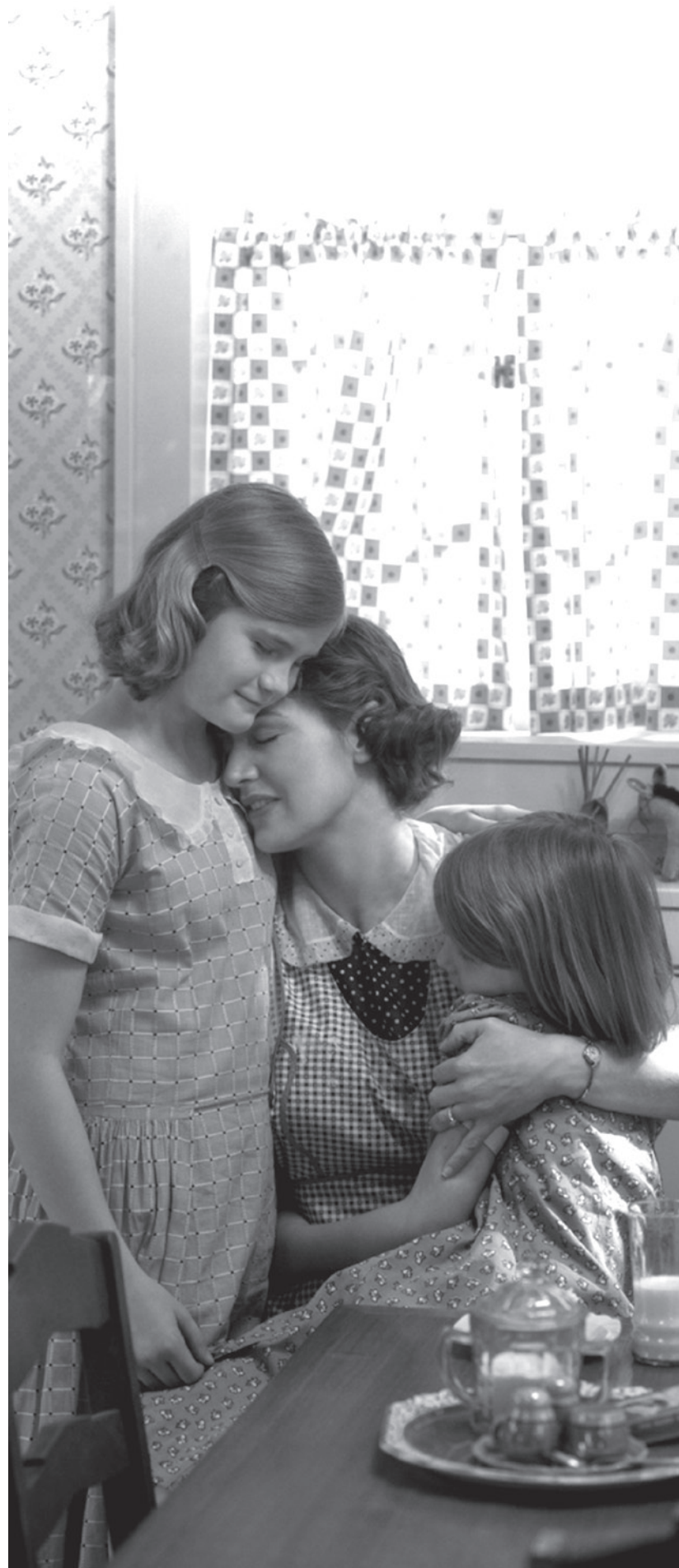
PHOTO: Embrasser les excès du mélodrame avec une sobriété exemplaire.