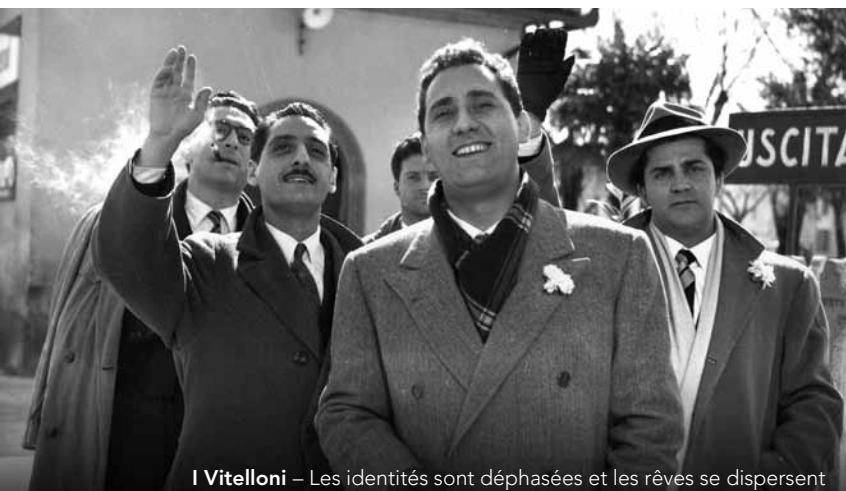
I Vitelloni – Les identités sont déphasées et les rêves se dispersent

Fausto tente de séduire une femme (une autre). Sa fiancée, Sandra Rubini, gagne le concours de Miss Sirène, mais s'évanouit devant la foule. Non pas à cause du trop d'émotion, mais parce qu'elle est enceinte. Nous apprenons que Fausto est le père (5 minutes).