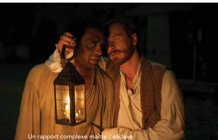
Un rapport complexe maître / esclave

Il n'était guère surprenant que McQueen s'intéresse tôt ou tard à l'esclavagisme. Le sujet semblait taillé sur mesure pour lui. D'abord parce qu'il est noir et que des membres de sa famille ont été esclaves dans les Caraïbes. Mais surtout parce que ses deux films précédents traitaient à leur façon de formes d'esclavagisme. Hunger (2008), son premier long métrage, décrivait le quotidien des prisonniers républicains nord-irlandais internés dans la prison de Maze, à Belfast, au début des années 1980, puis leur grève de la faim. Shame (2011), son deuxième film, mettait quant à lui en scène la descente aux enfers d'un homme qui finissait par devenir littéralement prisonnier de sa dépendance au sexe.