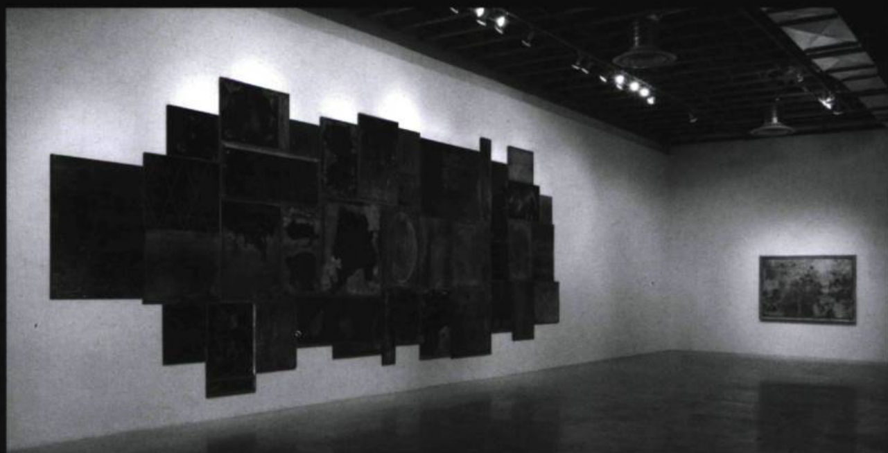
Nicolas Baier, Vanités 01 , 2007/2008. Vue d'installations. Épreuve au jet d'encre 345 X 900 cm. Paréidolies, MOCCA, Toronto, Hiver 2009.

L'exploration des potentialités expressives des images ainsi découvertes et travaillées a trouvé un de ses plus fabuleux aboutissements avec les Vanités : reflets de vieux miroirs numérisés et rassemblés en une immense et sublime mosaïque de reflets en camaïeux bleutés et grisâtres intitulée Vanitas I (2007). Baier ne donne plus alors seulement à voir du connu, du réel, du déjà-vu en puisant dans le réel, pour dénicher habilement une toile abstraite dans un bout de comptoir en formica ou dans l'assemblage de céramiques d'une salle de bain. Le jeu de fabrication de sens s'amplifie et se déploie indéfiniment avec cet immense écran. Les Vanités , toutes et chacune, permettent à quiconque s'approche d'elles de basculer dans un autre état à la recherche d'une portion de réel bien sûr, mais aussi et surtout d'une parcelle de mémoire, d'une partie de lui-même, de la vie et même de la mort. Dans le film Orphée (1950) de Cocteau, le miroir permet d'ailleurs ce passage d'un monde à l'autre. « Les miroirs sont les portes par lesquelles la mort vient et va », confie Heurtebise à Orphée en parlant du secret des secrets. « Du reste, regardez-vous toute votre vie dans une glace et vous verrez la mort travailler comme les abeilles dans une ruche de verre. »