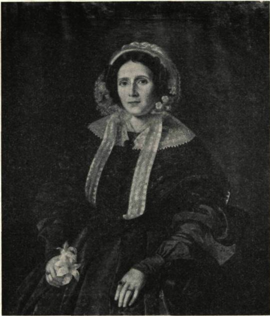
Cliché Inventaire des oeuvres d'art