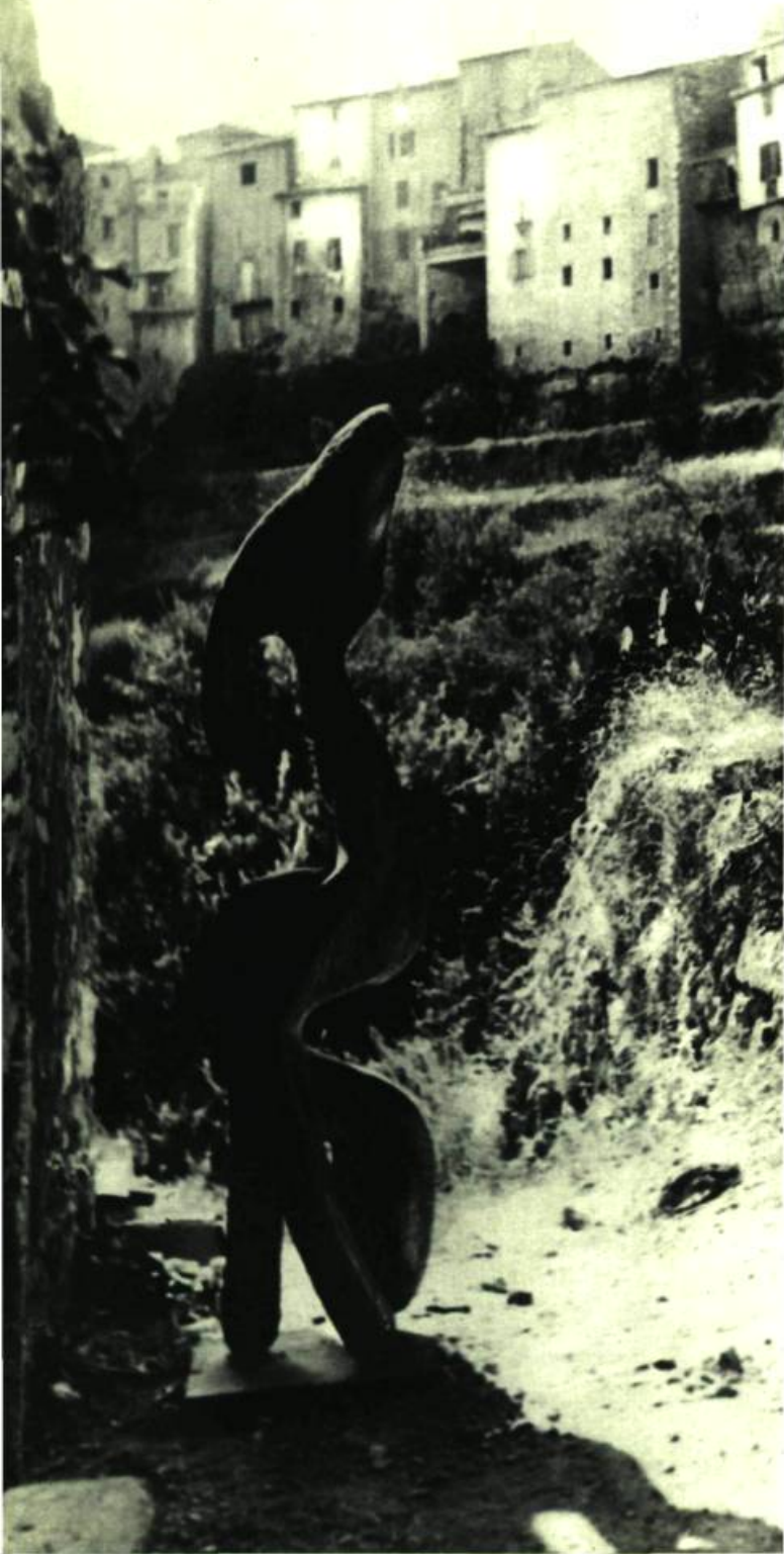
5. et 7. AU VILLAGE DE TOURRETTES SUR LOUP. Deux rues de Tourrettes sur Loup du premier Moulin habité par Robert Roussil dont une des sculptures garde l'entrée.