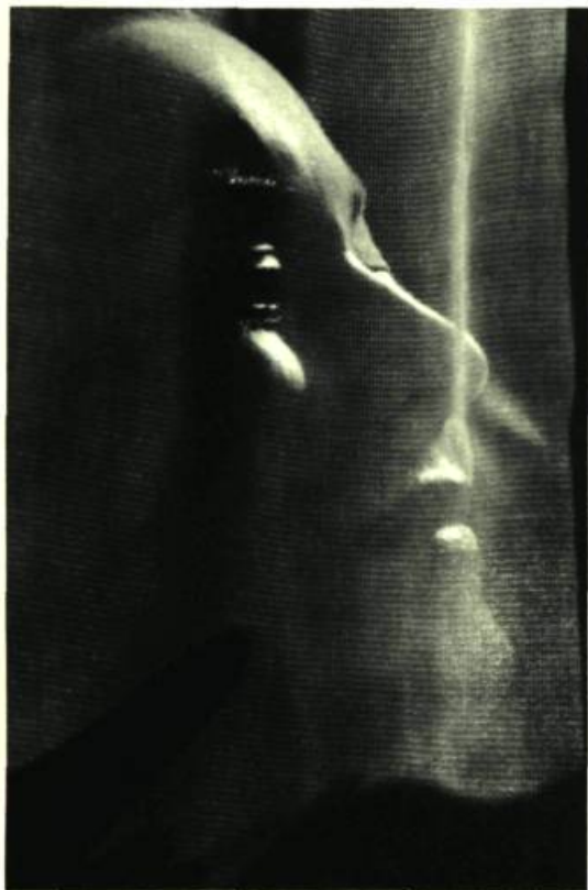
« Qu'on me mette en prison avec ma liberté »