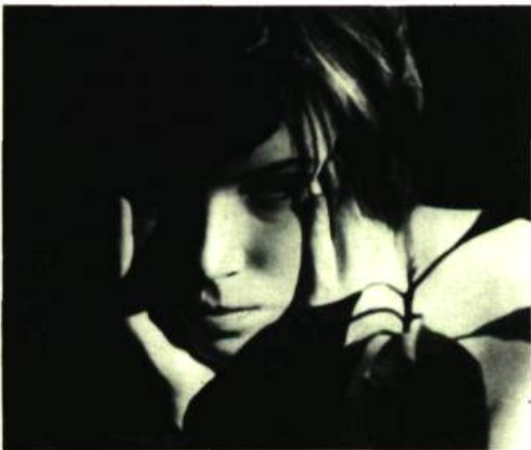
« Si mes mains étaient de terre j'aurais des fleurs au bout des doigts »...

Les légendes des photographies sont extraites de Au loin l'Espoir, poèmes de Gilbert Choquette.