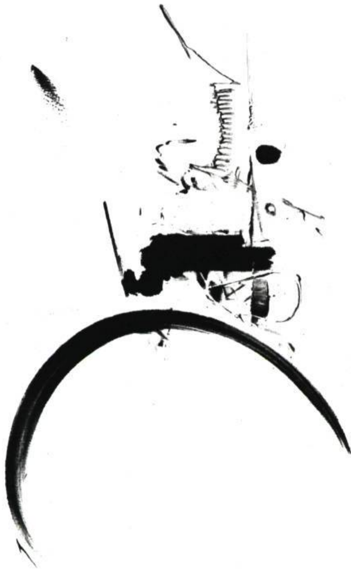
Un essai en verticale, intitulé « Pierre l'Ermite changeant les destinées de l'Orient et de l'Occident » (Camille Hèbert). Ici l'explosion semble assourdie par un tassement des éléments au-dessus de la courbe habituelle.