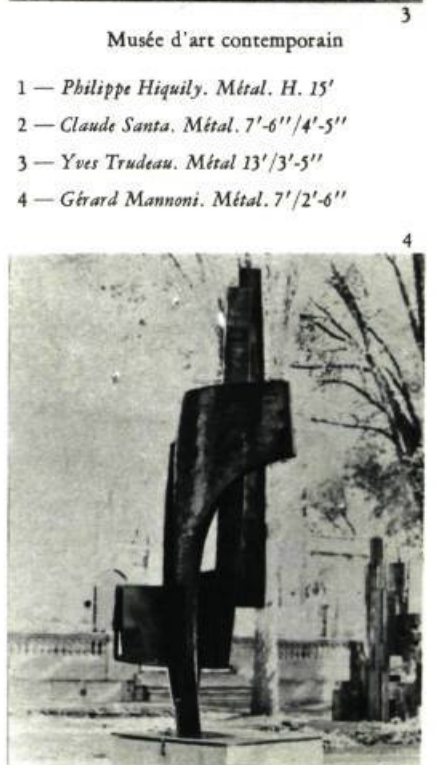
Musée d'art contemporain