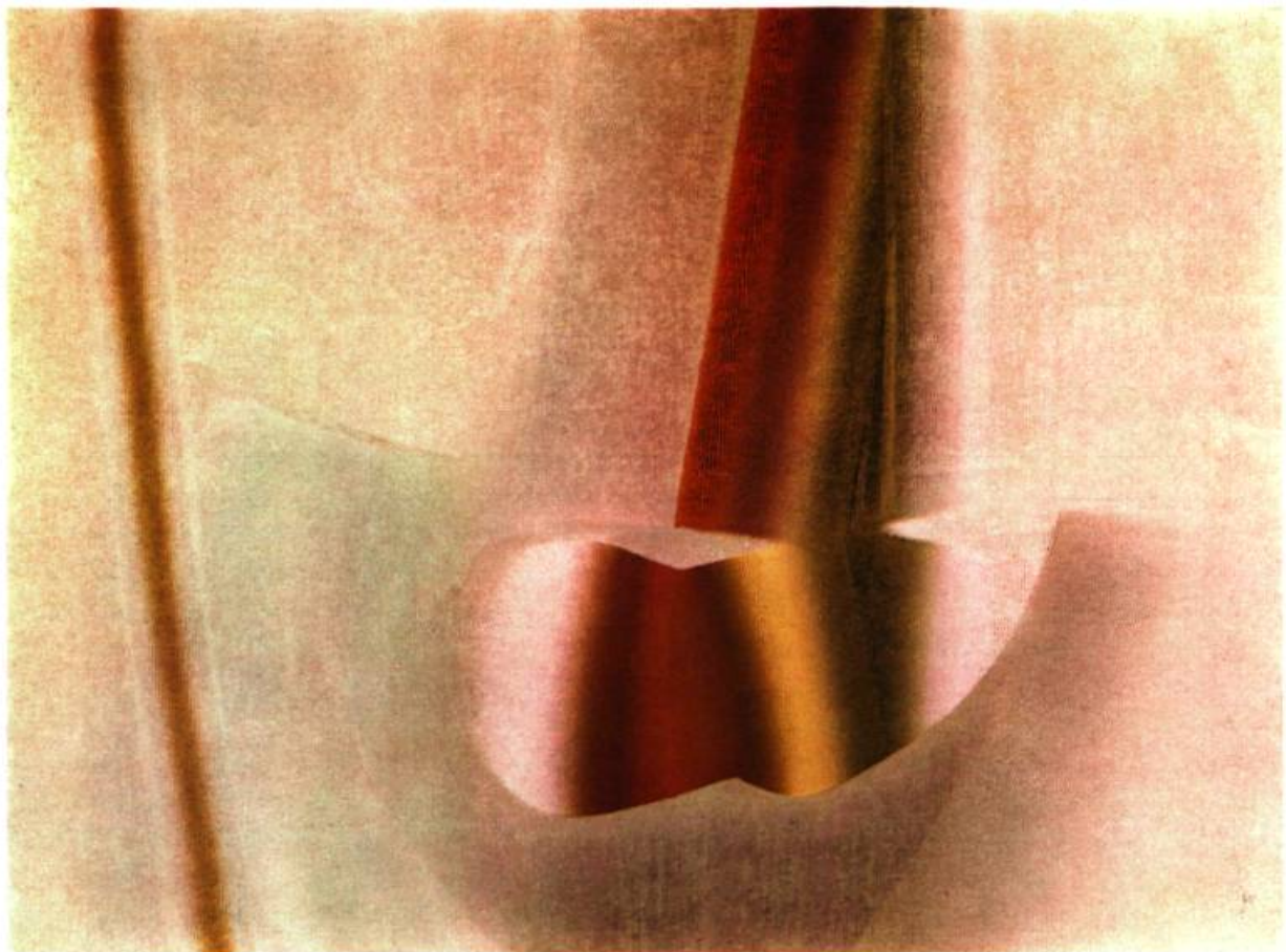
34—Louis Jaque. Le Signe de midi , 1966, huile sur toile. 38" x 51" (96,5 x 129,55 cm).