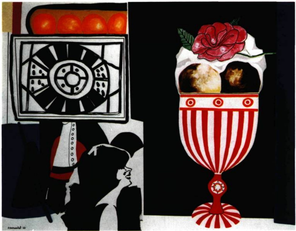
33—Albert Dumouchel. Un moment dans la vie d'Anne , 1966, acrylic sur toile. 48" x 60" (121,95 x 152,4 cm).