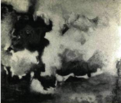
44—Réal Arsenault, Kamouraska , 1962. 63¼" x 51" (161,95 x 129,55 cm).